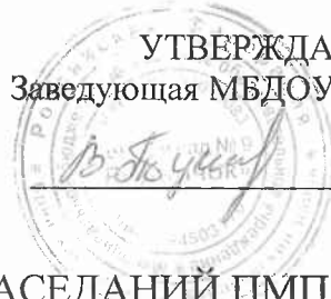
ГРАФИК ПЛАНОВЫХ ЗАСЕДАНИЙ ПМПк Муниципального бюджетного дошкольного образовательного учреждения № 9 «Родничок» на 2019-2020 учебный год